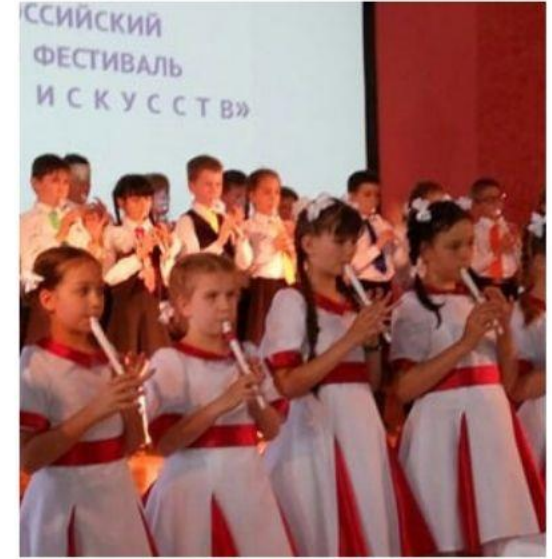
1-й Всероссийский фестиваль "Диалог Искусств", г. Анапа