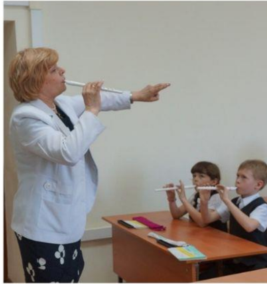
Открытый урок по обучению игре на свирели, г. Краснодар