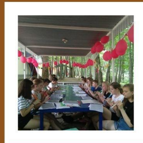
Программа летней выездной профильной смены по обучению игре на свирели "Лири"