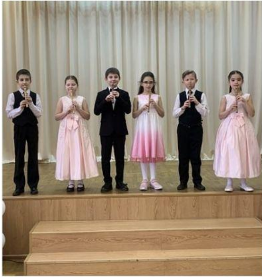
Игра на мастерской славянской свирели мастера В. Рыбина

Обучение игре на свирели дает возможность в процессе непосредственно игровой деятельности повышать уровень здоровьесбережения ребенка. Это происходит как на занятиях, где ребята осваивают инструмент и развивают дыхание, эмоциональное равновесие, музыкальность, так и на мероприятиях различного уровня, где они демонстрируют то, чему научились через сохранение исторического опыта и культуры своего народа, популяризацию данного инструмента среди людей разных возрастов. На сегодняшний день в процесс обучения игре на свирели вовлечено 9 школ г. Краснодара. Педагоги делятся опытом работы через открытые уроки, мастер-классы, методические семинары.