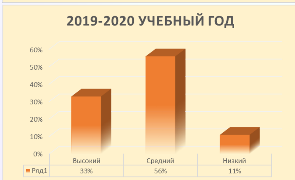
Сравнительная таблица увеличения охвата учащихся за период 2017-2020