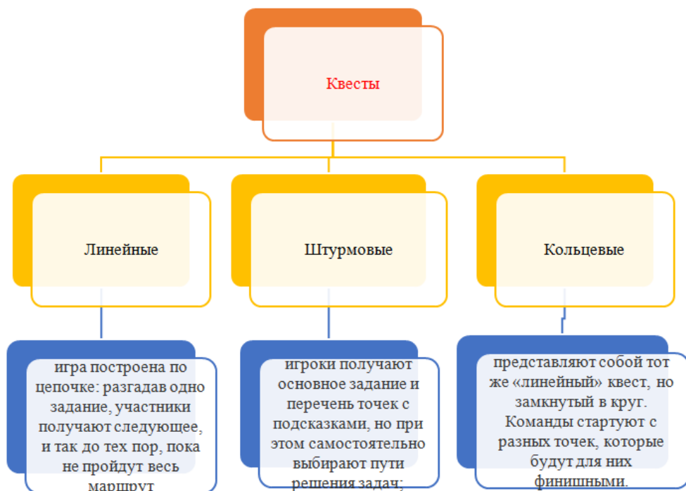
Рисунок 4. Виды квестов