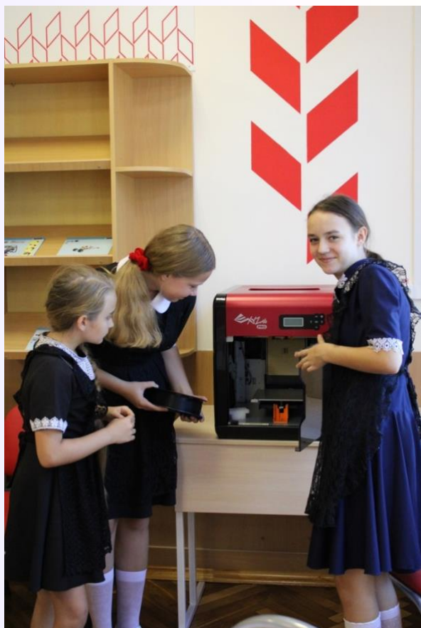
«ПРОВЕРЯЕМ СВОИ ИДЕИ»