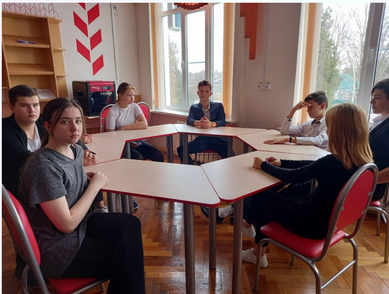
«МОЗГОВОЙ ШТУРМ ЗА КРУГЛЫМ СТОЛОМ»