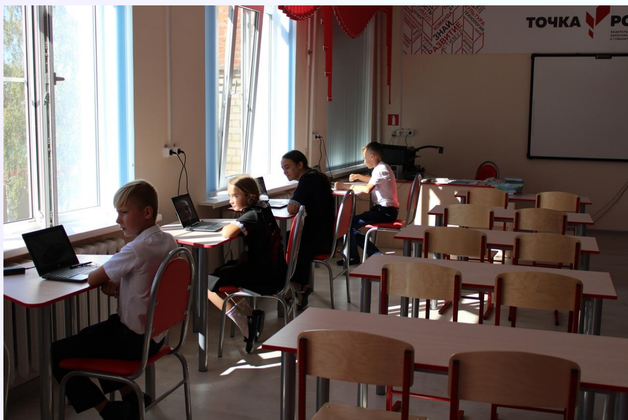
«В ПРОЦЕССЕ СОЗДАНИЯ ВИДЕООТКРЫТКИ»