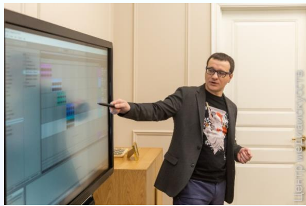
Объяснение работы программы Ableton Live