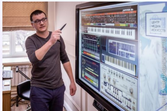
Процесс объяснения нового материала