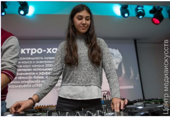
Выступление на Young Dj Session