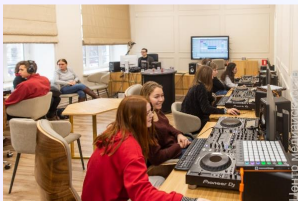
Программа «Проба музыкального пера»