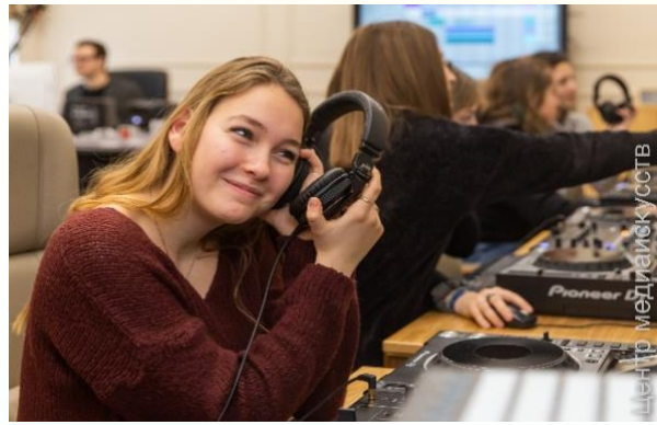
Программа «Проба музыкального пера» для лицеистов из г.Бордо, Франция