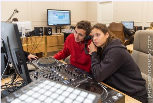
Проектная программа «Проба музыкального пера»