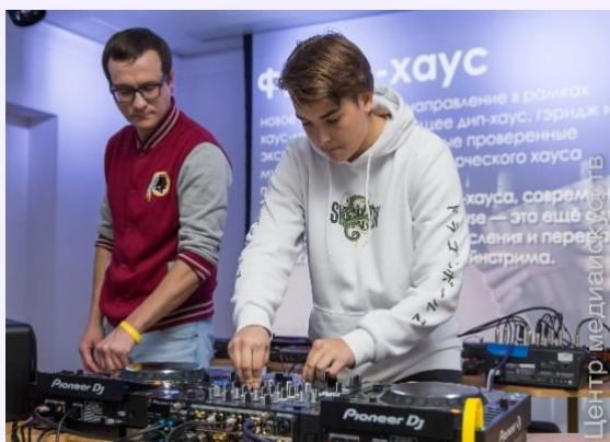
Выступление на Young Dj Session

https://vk.com/album-182908042_270027608